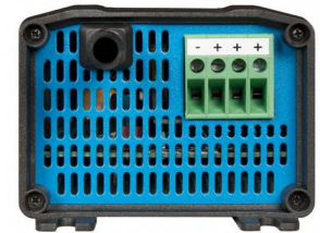
Model with 3 DC outputs