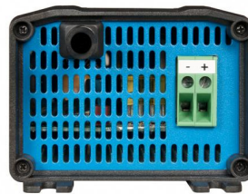
Model with 1 DC output